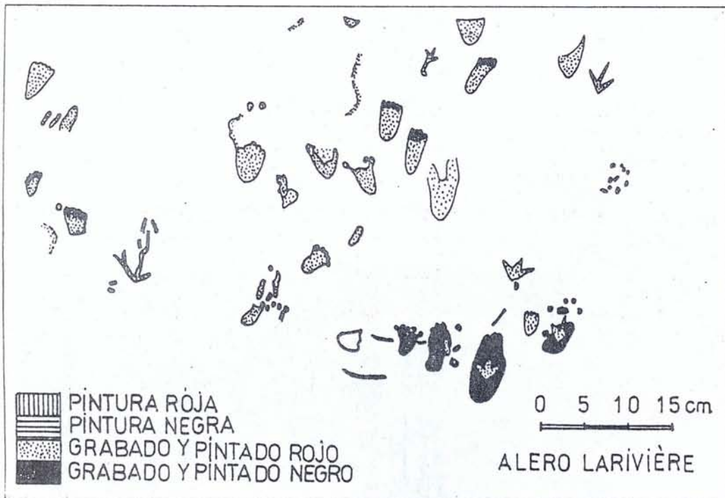
Figura Nº 2: Conjunto de motivos del sitio Alero Larivière.