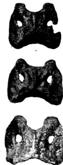
Fig. I. — Atlas. (1): Lama guanicoe Mul. (2): Auchenia cordubensis Amegh. (3): Palaeolama Weddellii (P. Gerv.).

Antes de entrar a tratar el asunto del Palaeolama , me referiré a una pieza de Camélido hallada por el Dr. Olsacher e Ing. Montes en depósitos Postpampeanos de la provincia de Córdoba, junto con trozos de cerámica y otros restos de mamíferos actuales. Del estudio de esta pieza se infiere